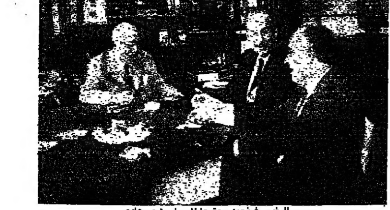
الرئيس فرنجيه مجتمعا الى ساسين وسعاده

اعلن الوزيران ميشال ساسين وجرود سعاده تبادلا للامانة للمفارة البيروقراطية وقال ان السفير البيروي يقوم بمساع خيرة للوصول الى حل نهائي للوضع. وكان الوزيران ساسين وسعاده قد زارا امس صر زغرنا عند الساعة الثانية عشرة ظهرا حيث استقبلهما الرئيس سليمان فرنجيه ورقد معهما خولة اسمرت حواء الساعة ثبوتات خلفها الاحداث حول مختلف القضايا السياسية الراهنة في البلاد والتحرك الذي يقوم به السفير البيروي في لبنان المونسنيور يابلو يوانتي لتحقيق الوفاق الليبناني وانهاء القتال في المنطقة الشرقية. هذا ووضع الوزيران سعاده وساسين الرئيس فرنجيه في اجواء المشارع التي يعادتها في صعيد وزراي الهاتف والعمل خلال المرحلة المقبلة، وكذلك سبل معالجة المشكلة الحاصلة للوطنين في ظل تصاعد حدة الغلاء وارتفاع الاسعار. وتناول الوزيران سعاده وساسين طعام الغداء في ملدة الرئيس فرنجيه حيث عقدت جولة ثانية من المحادثات، وقبل مغادرتهم قصر زغرنا اندل الوزير ميشال ساسين بتصريح لانه في وقت ما تكون هناك مواضع وطنية مهمة من الطبيعي ان تقوم بزيارة فخمة الرئيس فرنجيه للتداول والتشاور معه في الشؤون الراهنة وهذه المواضيع كانت مدار بحث مع فخامته.